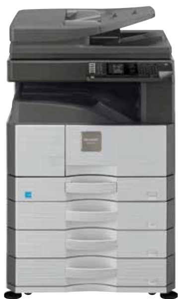
Pokazano model AR-6023N

AR-6023D/N AR-6020D/N AR-6020 Monochromatyczne urządzenie wielofunkcyjne