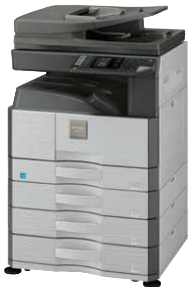
Pokazano model AR-6023N

Jeśli zależy Ci na pracy w sieci, wybierz model AR-6020N pracujący z prędkością 20 stron na minutę lub model AR-6023N pracujący z prędkością 23 stron na minutę. Jeśli potrzebujesz lokalnego urządzenia wielofunkcyjnego (druk poprzez USB), możesz ograniczyć wydatki, wybierając jeden z trzech modeli AR-6020D, AR-6020 i AR-6023D.